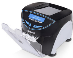
911BB071000713 PRINTER TK302III EJC VERT STACKER ETH USB RS232 AVIATION