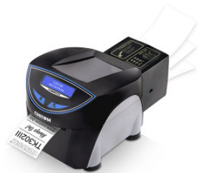
911BB080300713 PRINTER TK302III ATB TF888 ETH USB RS232 AVIATION

Via Berettine, 2 - 43010 Fontevivo PR - UST-.ID: IT02498250345 - TEL: +39 0521 680111 - FAX: +39 0521 610701 - EINDEUTIGER CODE: 8RQN7AZ