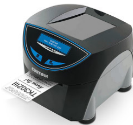
911BB070300713 PRINTER TK302III ETH USB RS232 AVIATION