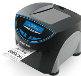
911BB090300713 PRINTER TK302III UHF RFID ETH USB RS232 AVIATION